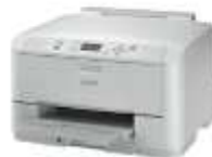
Generic / Text Only

La stampante va collegata con 2 driver diversi, uno per le stampe pdf e uno per quelle di testo.