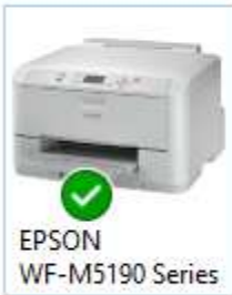
EPSON WF-M5190 Series